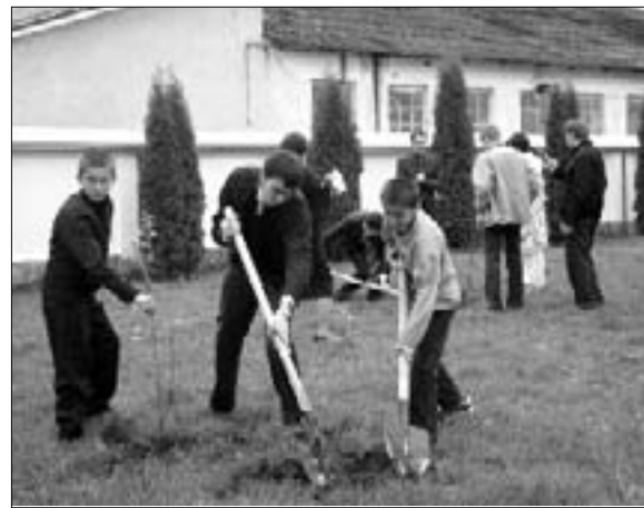
Закладка "Семейного сада"

Конференция закончилась социальной акцией Молодежного правительства КБР: дети и молодые министры посадили «Семейный сад» во дворе реабилитационного центра «Намыс». Деревья вырастут, и здесь будет