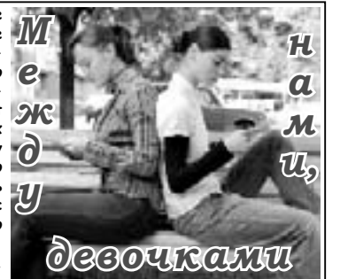
М е ж д у д е в о ч к а м и