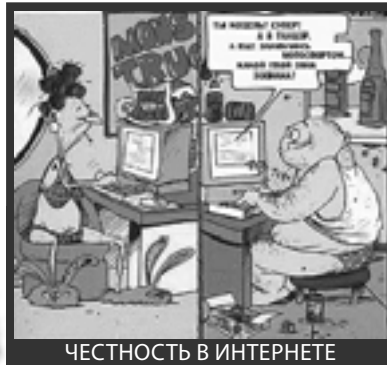
ЧЕСТНОСТЬ В ИНТЕРНЕТЕ