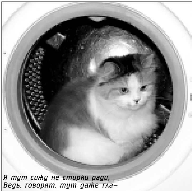
Я тут сижу не стирки ради, Ведь, говорят, тут даже гла- ция!