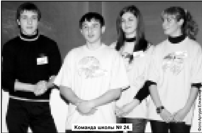
Команда школы № 24.