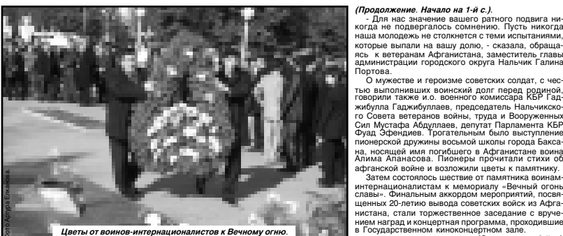
Цветы от воинов-интернационалистов к Вечному огню.