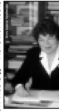
В Кабардино-Балкарии, имеющей более 300 тыс. гектаров естественных пастбищных и сенокосных угодий...