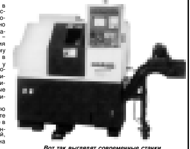
Вот так выглядят современные станки.