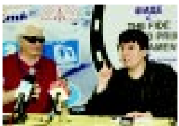
Борис Спасский и Нона Гаприндашвили.

- Ситуация по-прежнему непростая, у нас есть талантливые дети, которые занимают высокие места на различных турнирах, но когда подходит время взрослых шахмат, они терпят, - сказала Н. Гаприндашвили. - Это происходит потому, что нет экономической поддержки. В соседних Азербайджане и Армении шахматам уделяют большое внимание. В Грузии богатые традиции, дети охотно идут в кружки и секции. На протяжении 29 лет шахматную корону опирали мы с Майей Чибурдадзе. Народ привыкший к таким резуль-