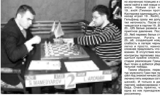
Материалы подготовлены спортивным обозревателем Альбертом Дышековым и фотокорреспондентами Артуром Елкановым и Камалом Толгуровым.

– судьи Эльбурского районного суда КБР; – судьи Нальчикского городского суда. Соответствующие документы и заявления от претендентов принимаются по адресу: 360000, г. Нальчик, ул. Пачева, 12, здание Верховного суда КБР. Квалификационная коллегия судей КБР. Последний день приема документов – 22 мая 2009 г. до 18 часов. О дате рассмотрения заявлений претендентов будет сообщено дополнительно.