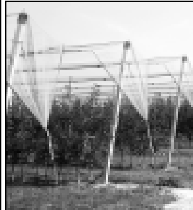
Сад «Перспектива» в Нальчике.

На четвертый год аналогичный современный сад начина-