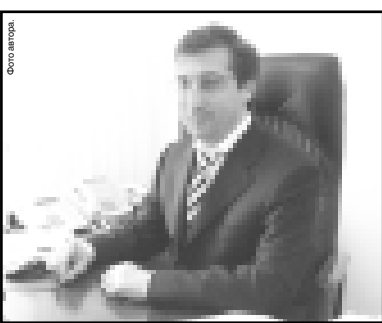
Задача становится строительством ряда энергогенерирующих объектов. В рамках программы завершить строительство Каскада Нижне-Черекских ГЭС, а также простроить ГЭС на реках Така-Су, Альп-Су № 2 и Черекской Малой ГЭС.

Основными инфраструктурными направлениями развития экономики республики является наличие высокой зависимости от внешних поставщиков энергоресурсов, особенно электроэнергетики. Как стратегическую задачу становится строительством ряда энергогенерирующих объектов. В рамках программы завершить строительство Каскада Нижне-Черекских ГЭС, а также простроить ГЭС на реках Така-Су, Альп-Су № 2 и Черекской Малой ГЭС. Ввод их в эксплуатацию позволит на 60 процентов решить проблему энерго-