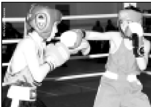
Материалы рубрики подготовил спортивный обозреватель Альберт ДЫШКОВ.

Из победителей первенства КБР сформирована сборная республика для участия в первенстве ЦС «Юность России».