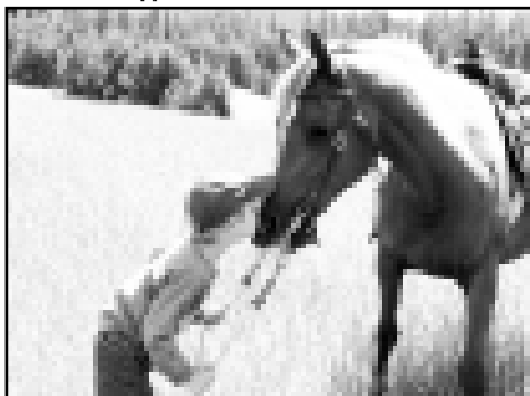
Нужен к лошади подход: нежность города берет!