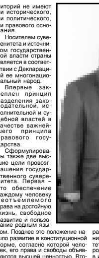
Анур Чеченов, Председатель Парламента КБР

суверенных и национально-культурных формах. Связь между депутатами РФСФР также подтверждает необходимость существенного расширения прав, в том числе автономных республик. Этими нововведениями депутаты РФСФР также подтвердили необходимость существенного расширения прав, в том числе автономных республик.