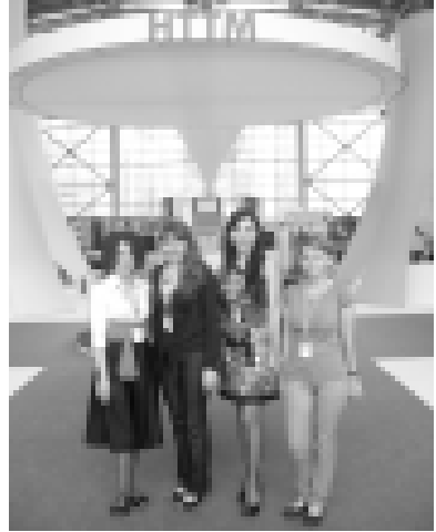
демонстрацию достижений в научно-технической деятельности и содействии развитию научно-технического потенциала молодежи Кабардино-Балкарский государственный университет г. Нальчик.

Свои научно-исследовательские проекты и изобретения демонстрировали молодые российские ученые и изобретатели от 6 до 27 лет. Лучшие досуговые центры научно-технического творчества молодежи, школы, профильные высшие и средние технические учебные заведения России. Экспертную сторону представляли десять крупнейших государственных корпораций, таких, как «Ростом», «Ростехнологии», «Союз машиностроителей России», «Оборонпром», «Росанно», «Роскосмос», «Российские железные дороги», «Солерс», «Объединенная авиастроительная компания», известные российские ученые, инженеры, общественные деятели.