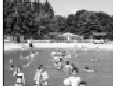
Бассейн похаж на маленькое море, в котором можно сластить от жары.

Они отремонтировали бассейн и привели прилегающую к нему территорию в порядок. Каждое утро в парке и его филиалах ремонтно-строительная бригада осматривает и проверяет аттракционы, их готовность к работе.