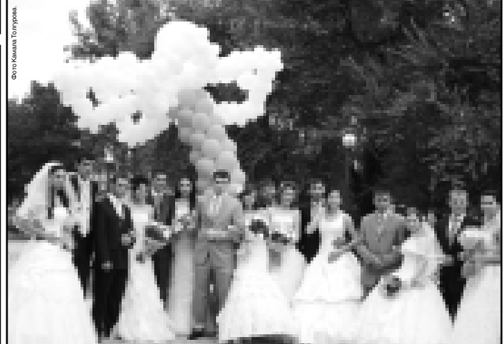
Ромашка – символ праздника.