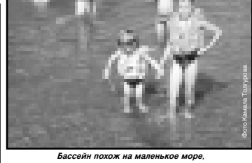
Бассейн похаж на маленькое море, в котором можно сластить от жары.

Городок аттракционов парка, работающий с 1923 года, имеет свои филиалы в районе Исхож, неподалеку от Национальной библиотеки, а также рядом с кинотеатром «Аврора».