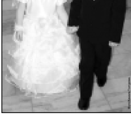
Маленькие «жених» и «невеста» украсили торжество.