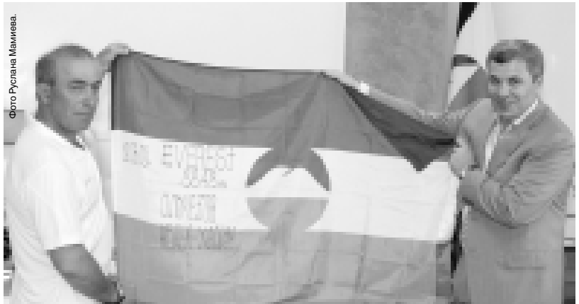
Фото Руслана Мамаева.

Пресс-служба Президента и Правительства КБР