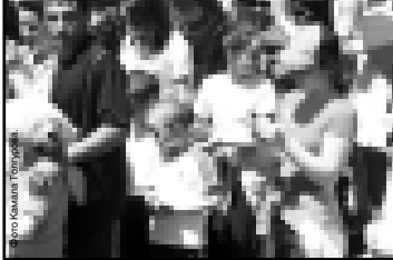
«Золотой ледоруб» от клуба «Семь вершин».