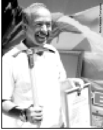
«Золотой ледоруб» от клуба «Семь вершин».