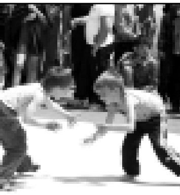
Соревнование юных борцов.