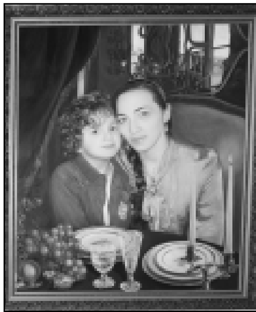
Портрет внука Магомеда с мамой.

Выступившие на открытии экспозиции директор музея ИЗО Е.