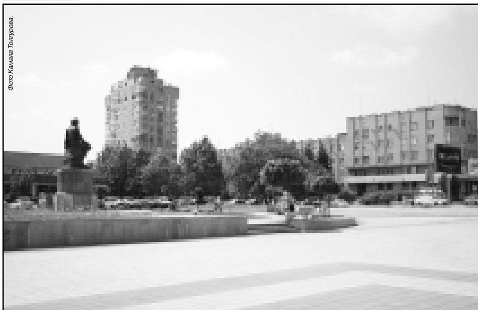
Фото Кавказа Толгурова.