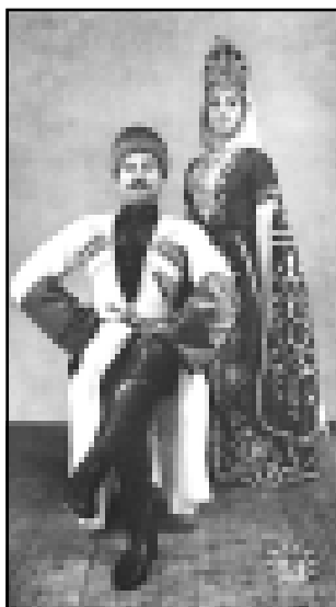
Портрет внука Магомеда с мамой.

Его «концертный костюм», - разумеется, черескя. В обыденной жизни артист предпочитает свободный стиль. «Все зависит от ситуации, - говорит он, - кроме того, необходим элементарный вкус: под спортивную одежду нельзя надевать туфли, а строгий деловой костюм никак не сочетается с кроссовками или кедами. Марка производителя для меня не имеет значения, главное, чтобы одежда была удобной. Мой имиджмейкер - жена. Она никогда не навязывает свою точку зрения, но по ее реакции всегда вижу, стоит покупать вещь или нет».