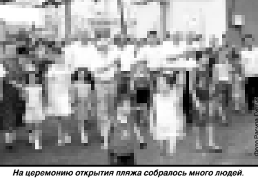
На церемонии открытия пляжа собралось много людей.