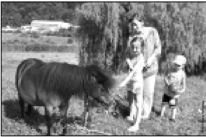
Фотоканалом Канала Толгурова

нятиям с тренером. В 2008 году в «Радуге» за счет средств республиканского бюджета отдохнули 4960 детей из многодетных, малоимущих семей, из них 320 детей-инвалидов в сопровождении матерей. В этом году планируют увеличить количество маленьких отдыхающих.