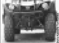
Теперь можно прокатиться на квадроцикле.

Надежды, которые с удовольствием проводили время у озера. Мы приходим сюда каждый раз, как приезжаем в Нальчик. Здесь очень хорошо, нам нравится, вода теплая, солнце ласковое.