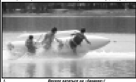
Весело кататься на «бананке»!

Надежды, которые с удовольствием проводили время у озера. Мы приходим сюда каждый раз, как приезжаем в Нальчик. Здесь очень хорошо, нам нравится, вода теплая, солнце ласковое.