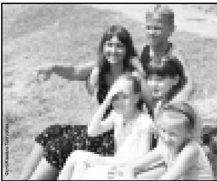
Гости из Екатеринбурга.

Люди придут после обеда, — пообещали посетителям катмаранов. На берегу мусор надо еще поискать, да и озеро чистое. В прошлом году сюда посадили рыбок, которые его очищают. Да и вообще озеро преобразилось: закупили семнадцать катмаранов, «бананку», квадроциклы.