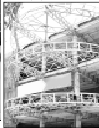
Так сейчас выглядит будущий центр.