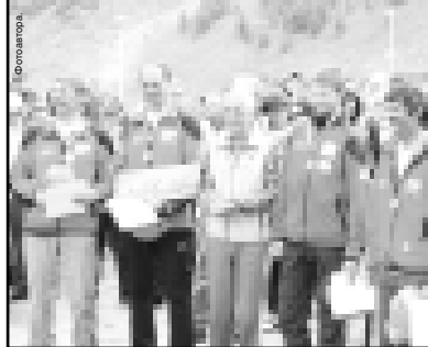
Участники фестиваля с наградами.

(Окончание. Начало на 1-й с.) Нико не запятнавших себя убийствами, являлись с повинной в правоохранительные органы. По понятным причинам называть их имена не стану, ответственность за произошедшее лежит на тех, кто в результате процессуальных проверок возбуждено 38 уголовных дел, более двадцати из них — по поводу убийства и превышения должностных полномочий, остальные — дача и получение взятки, мошенничество, хищения, служебный подлог и даже невыплата заработной платы. Буквально на днях возбуждено уголовное дело в отношении бывшего высокопоставленного филиала Нальчикского филиала Краснодарского университета МВД, занимавшегося поборами со студентов. Безусловно, нет такой страны в мире, которая победила бы коррупцию. Но стремиться к этому надо, чем мы и занимаемся довольно активно.