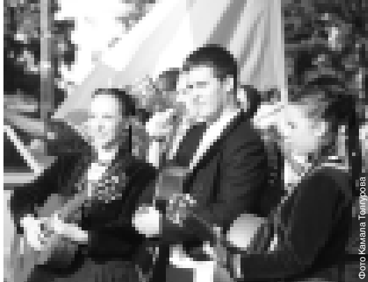
Испанская серенада для жителей Кабардино-Балкарии.

Далее с песнями и танцами колонна направилась к площади Абхазии. Пройдя под символической аркой, участники шествия торжественно вошли в Деревню мастеров и присоединились к празднику национального костюма. С самого утра здесь кипела оживленная работа – районы республики обустроили традиционные подворья. В каждом дворе готовились национальные блюда, которые мог продегустировать любой желающий. А на сценической площадке шел концерт с участием артистов нашей республики и гостей фестиваля. Фольклорно-этнографический праздник продолжался допоздна и надолго запомнится всем зрителям и участникам.