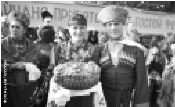
Хлеб-соль от казаков.