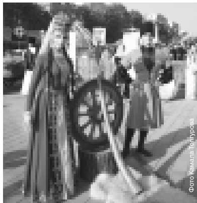
Как и в старину, звуки гью (каб. - «зовущий людей») пригласили всех на праздник.

Для студентов колледжа культуры и искусств СКГИИ встречи с иностранными коллегами были не только интересны в общекультурном плане, но и полезны с профессиональной точки зрения. Хореографы, музыканты, дизайнеры многое почерпнули во время концертных программ и бесед с представителями Индии и Испании. Особая специфика учебного заведения предопределила внимание к деталям, нюансам костюма, пластики, интонирования. Несмотря на то, что прибывшие на фестиваль коллективы самодельные, их творчество представляет немалый интерес для тех, кто занимается искусством профессионально.