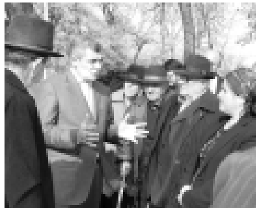
На встречах Президента КБР Арсена Канокова с жителями Кабардино-Балкарии поднимаются самые разные вопросы. Все они находят понимание и поддержку главы республики.

Сердечно поздравляю жителей Кабардино-Балкарии с Днем народного единства, желаю всем здоровья, успехов в осуществлении всех планов и надежд, радости и благополучия в семьях. Любите и берегите свое Отечество!