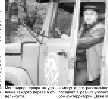
Минприроднадзора на удалении каждого дерева в отдельности.

Условия городских кварталов гораздо сложнее, чем в парке: сплеленная ветка не должна неожиданно упасть на проезжую или проезжающий автомобиль. Плановая валка деревьев производится не спонтанно, а по официальной заявке городского департамента ЖКХ и с разрешения