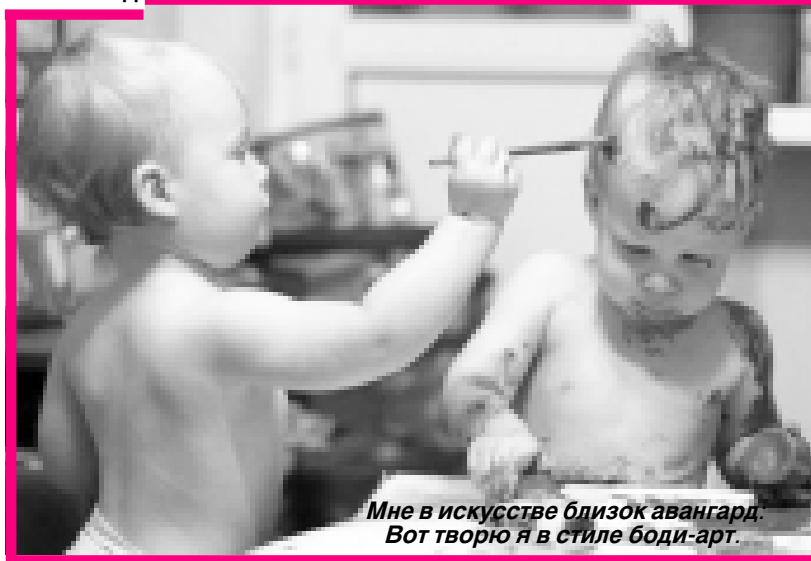
Мне в искусстве близок авангард. Вот творю я в стиле боди-арт.