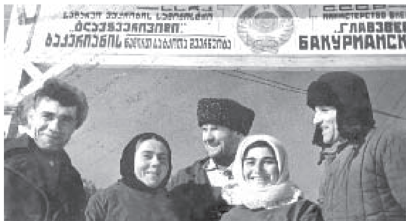
Мамашланы Адилгерий ишчилери бла

Сейир адамларындан бири Мамашны жашы Таусолтан болгъанды. Былагъа байлыкъ да аны заманында къонуп тебирегенди. Аны бла