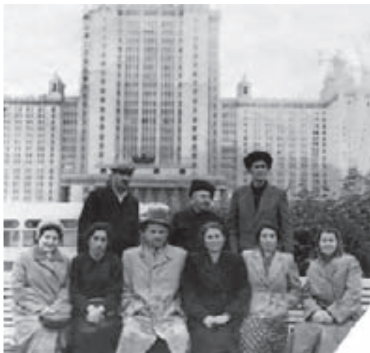
Мамашланы Адилгерий ишчилери бла Москвагъа ВДНХагъа баргъанда

Къошладан биринде тохтагъан кезиуде муну ушкогуна суу къуядыла. Сакълап тургъан, Мамаш улу жууукълаша келгенлей, атады да, аны кёкюрегинден урады.