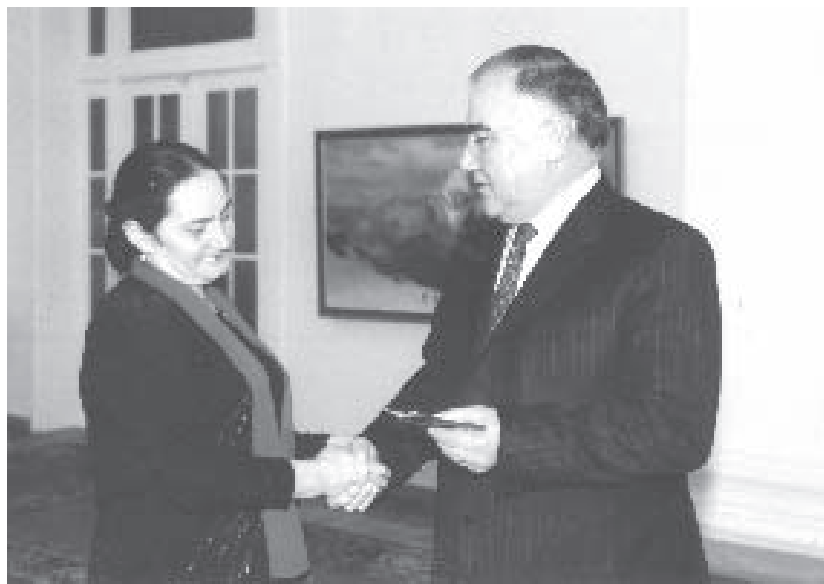
КъМР-ни Президенти В.М.Коков Туменланы Ларисаны КъМР-ни халкъъга билим берууде ишлегенлерини сыйлы къуллукъчусу деген атха тийишли болгъаны бла алгъышлайды, 2002 ж.

Бюгюн ол кюн Кязимни музейинде кѣрген затларыбызны санай турмайбыз. Бу ишни къурагъан – бери жол да, мында музей да, поэтни