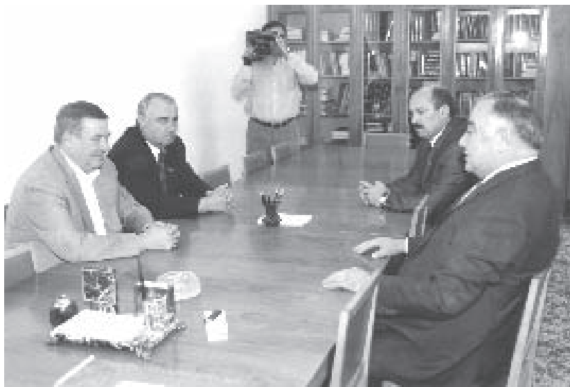
РФ-ни Госдумасыны Председатели Г.Селезнев Нальчикге келген кезиуде. Суратда: (сол жанында) Г.Селезнев, З.Нахушев; (оңг жанында) В.Коков эм М.Туменов. 2003 ж.

халкьны ийнандыргъанын да, КъМР-ни урунуу эм халкьны социально жалчытыу министрини къуллугъуна тюшгенинде да кесин кетюрмегенди; ол биз таныгъан Мурадин Мурадинлей къалгъанды. Бюгюн бизге бу тизгинлени жазаргъа базындыргъан да ма ол шартладыла.