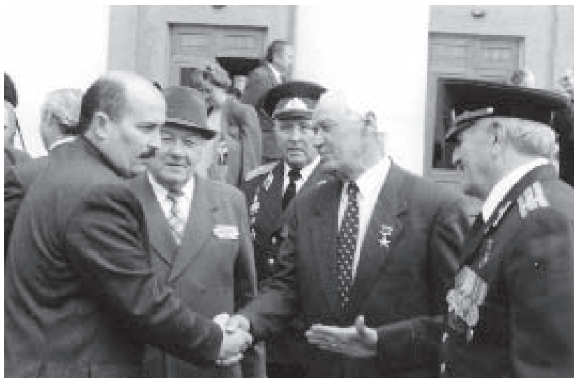
КъМР-ни Урунуу эм Социально айныууну министри Туменланы Мурадин урунууну эм урушну ветеранлары бла тюбеишген кезиу, 2004 ж.

тарып-къайтарып айтадыла къырал къуллукълада ишлегенле, ол эллени адамлары бюгюн-бюгече да.