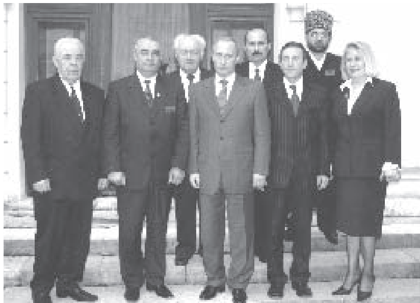
Сочиде Кавказны бла Россейни Юг жанында халкъларыны жамауат биригюлерини заседаниясында. 26.03.2004 ж.