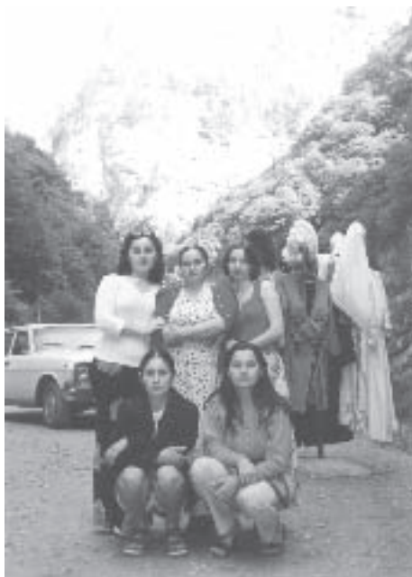
Мурадинни юйюрю 2000 ж.

Быйыл бешинчи августда Мурадиннге алтмыш жыл толгъанды. Ол къадарына ыразыды. «Мен кесиме бир заманда да къуллукъ излемеген- ме, – дейди Тумен улу, – ишле деген жерлеринде къолумдан келгенича ишлегенме. Сёзсюз, не менме деген оноучу да хар инсанны бирча ыразы этип да баралмайды. Ол зат аны къолундан келлик туююдю. Алай хал- кыгъа къуллукъ этмеклиг’ а – насынды».