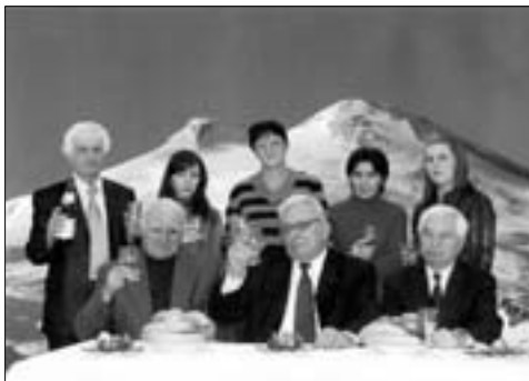
«Цуащхьэмахуэ» журналым къыщыдэлажьэхэм я гьусэу. 2008 гьэ