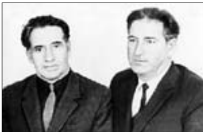
Сурэтым: КъардэнгъушI Зырамыку ХъэдэгъэлI Аскэр и гъусэу

Дыкъыззымыпэсыжу щIэпхуэжу, «Iуашхъэмахуэ» щыгум тетIыс-хъэжа мо Iутыжми зерищIэци, ди институтым и лэжыгъэр нэхъыбэу зэпхар щIэчэ имыIэу къэкIухынараш: гъэщIэгъуэн гуэрхэр къэульэпхъэ-щын, къэхутэн. Абыхэм улъыхуэурэ, дунейр зэгъэкIэсын. Къепхъэ-лахэр кхъузанэ IэджкIэ ухуэнщIыжауэ, ахэр зей цIыхубэм я пашхъэм илхъэжын. Мис апхуэдэ къалэнхэр дгъэзащIурэ, а гъэм лIы гуп ды-кIуат Псыжъ адрыщI щыпсэу ди къуэш адыгэхэм я деж. Зи гугъу сщIыр шэрджэхсэракъым. Абыхэмрэ дэрэ, дызэрызэхъэщыкI щIагъуэ щы-мыIэу, ди бзэки ди хабзэки дызэтохуэ. Зы къуэпсым дыкъытеклами, адыгейхэмрэ дэрэ зыкъомкIэ дызэхъэщыкIлаш – ди уэрэд жылэкIэхэмкIи, къэфэкIэхэмкIи, пшынэбзэхэмкIи. Мохэр нэхъ псынщIэщ. Жыы нэхъ ящIэщ. Ауэ, ухуеймэ, псомкIи задебгъэкIуфынуш.