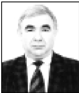
Коль в сердце значится графа: Для Бога автографа!