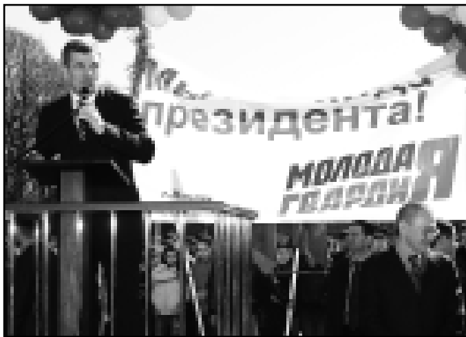
19 февраля представители городского штаба движения «Молодая гвардия» провели в Нальчике шествие молодежи в поддержку президента Кабардино-Балкарии Арсена Каноква.

Две колонны молодых людей одновременно начали движение навстречу друг другу по проспекту Ленина и встретились на площади Согласия перед Домом правительства КБР, где прошел импровизированный митинг с участием главы республики Арсена Каноква.