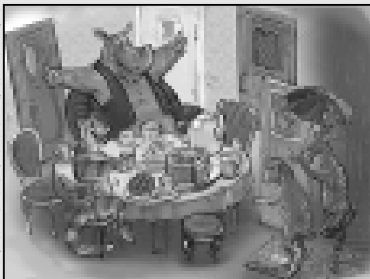
Полосу подготовила Марина Маршенкулова.

Причина №4. У гостей есть одна маленькая, но зло-