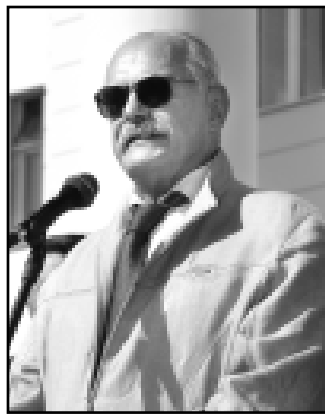
Б. М.

Затем участники митинга возложили цветы к мемориальным доскам Героев Советского Союза и России, а курсанты нальчикского филиала Краснодарского университета МВД России приняли присягу.