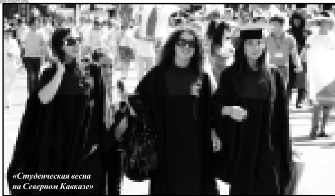
«Студенческая весна на Северном Кавказе»

- Открыта вторая очередь канатной дороги – новейшая модель с 8-местными гондолами производства французской фирмы «РОМА». Ее протяженность – 1800 м, пропускная способность – 2400 человек в час.