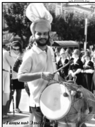
«Танцы над Эльбрусом»

- В КБР прошел второй международный фольклорный фестиваль «Танцы над Эльбрусом» с участием коллективов из России, Ирана, Италии, Африки, Индии, Испании.