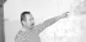
Атабийланы Асхат коридорда болум бла шагьрей этеди.

РФ-ни МЧС-ни КъМР-де Баш управленасыны От тошоунде надзор этуу жаны бла кылар управленасыны «Жашуу журт-2009» деген надзор-профилактика операция бардырыды. Аны бла байламчы барла ички управленасынын кесирини журналистке бла бирге шахарда оргналар бир кыуум оргналык тинтир мура да рейд кыуралганды.