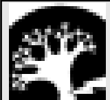
Малқар халк тууган жеринден зор бол кёчүрөгөлгилни 65-жылгылына