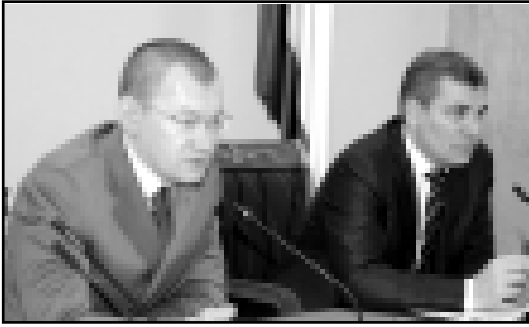
Баш кон КъМР-ни Правительствосуну ююнде кезилеу кенгеши бардырылганды. Анга республиканы Президентни Арсен Канокос эм Правительствосуну Председатели Андрей Ярин къатышганды.

Жыйылыну ача, Арсен Канокос бек алгъа КъМР-ни Парламентине депутатланы айыру республикада тап этген белгиле, шахар эм район администрациялары башчылары ол ишни тынгы бардырыуа себеплик этгенери ючюн ыразылганы билдиргенди.