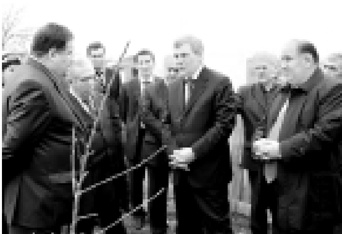
Президент А.Канокос эм аны нёгерлери телпикала комплексни энчиликлерини юсюнден оюмларын айтхан кезиу.

Сёзлерине табылгъандыла Швёндю экономика болум, хар жердеча, бизде да чырмаула чыгъара эсе да, республикада атгъа баргъану мадарады этилдиле. Огъан геурге кюн Бахсан районда республиканы Президентни Арасн Каноковун эм башха жууалпы кълулукъчуланы кълатшыулары бла «Агро-ком» телпика комплекс ачылгъанды. Ол кълуанчы ишге жыйылгъанча - республикалы ведомстволаны, торлю-торлю жамауат организациланы, биригилени, районну элгерин астангъа информационал органнаны келечилери сейр этдирича къл затла бар эдиле. Билдиргенича, телпика комплекс италчаны «LVCCHINI» фирманы технологиясына кер ишленгенди. Аны кълурулуш былыр март айда башланган эди. Комплексте 30 гектар жер бөлюннген эди да, аны 10 гектарлыкъ биринчи кесеге 2008 жылны ахарны хазыр боллукъду деп ышандыргъан эдиле фирманы келечилери. Ала сёзлерине табылгъандыла. Бир жылны ичинде 10 гектарны кълара толугурпы кетерилли, аны орусия экология жаны бла таза зыгыр кълуолгъанды, конструкцияла эм торлю-торлю оборудувана орнатылып, ол жерни башы толусулай жыйылгъанды. Битимлен хар бирине аны «ун» жарашдырылып, тамына амукъ бла асуу-барыча, урлукъ салырга этилгенди.