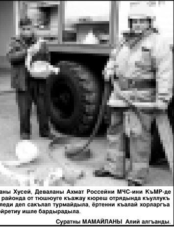
Суратын МАМАИЛАНЫ Алай алгьанды.

Каркаланы Запим, Гаспыланы Хусей, Деваланы Ахмат Россейни МЧС-ини КьМР-де Баш управленисны Черек районда ол тошоугу кьажу кореш отрядьында куулуьк этедиле. Ала хата кьачан келеди деп такшап турмайдыла, ертенчи кыала харларга кергени юсюенди дайым юйретуу ишле бардырадыла.