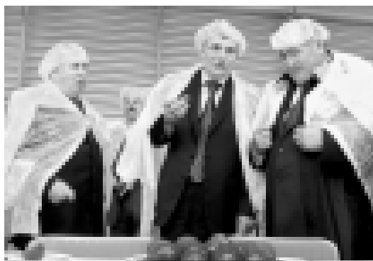
Оночу кыуум жаңы комплекде ёсдорюлген помидорланы татыуларын кере турадыла.

Президент эм аны биресиине айланганда, тапчана комплекде жаны терк айнырды, ол хайыр да берлик терк бахчаны мурдору салына турган жерде да болганды. Анда да италиялык технология хайырланлыктыды. «Юнакокс» агрофирманы бахчасында теркичекте орнала