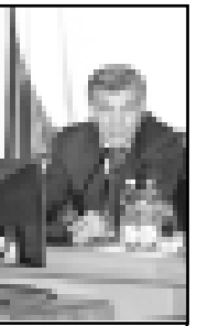
нун мадарларындан бири - аны арендада берюуду. Министр айтканга кере, республикада арендада 94,5 минг гектардан артыкъ жер бериледи, бусагъатда 374 келишимге кюл салынганды. Озган жылда арендадан 11 миллион 514 мингден аспам фойда тошенди, быйлыны биринчи кварталында уа 2 миллион бла 700 минг сом. Алай болгъанлыкъга, бююнлюкте 196 участка исекди, 165 жерни арендада берюно юсюнден документле хазырлана туралыда, алгыннгы арендакторлары аха телемегенери ючюн 31 участка сыйырылган этгенди, анта да 128 иш суд органлады, о жерле да сыйырылган этерикди.