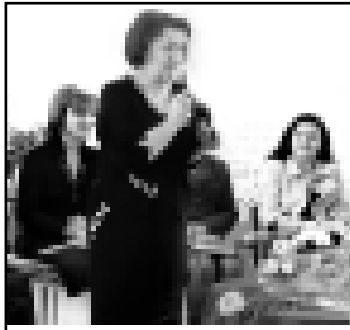
Занжоланы Фейла ингири кыргызанлаагы ыраазылыгы билдиргенди.