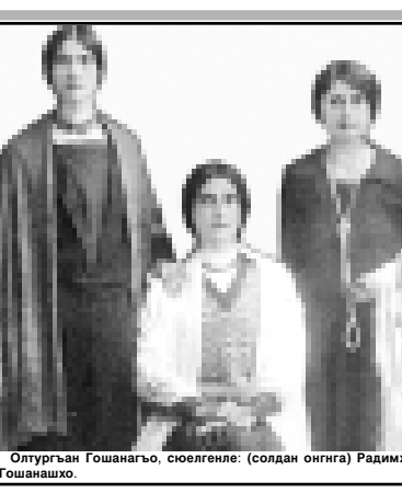
Огушархан Гошангаю, сюелгеня: (солдан онгнга) Радимхан, Опташанхо.