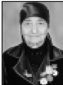
1944 жылда, битеу да малкыр халкыны Азияга көнүргөндө...