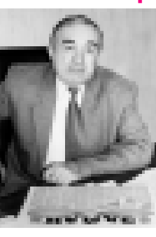
Ахыры 2-чи беттеди.

Газетибизге бирси кюн 85 жыл толады. Он кёпмоду, азмды? Тарыхы бла алып къарганда, кёп да торююдо. Алай, иги сагъыш этсенг, ол кезилуу ичинде къаллай бир жигитлик этилгенин, бушууу иш да болганын акъылынга келтирсенг - ол сау ёмурдо.