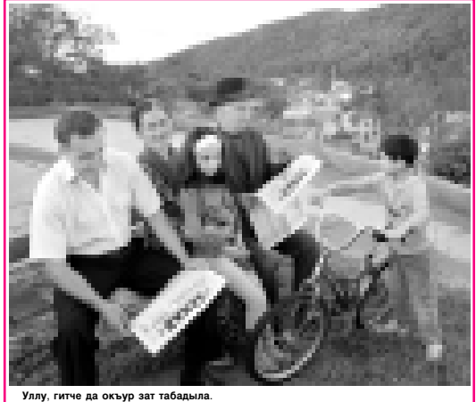
Уллу, гиче да окур зат табадыла.