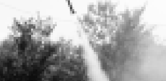
«Элиа-2» установка сынауучу кезиунде.

Псыно алай тийресиинде Бийик тау-геоидика институту бу жаууга кышах койоршен жер барды. Баш кюн анда ЮГ федеральный округдан айтылган институтан да келип кеп алимине жыйылганы эдиле. Ала бу жаууга кышах койорше ракетада атырганын «Элиа-2» установканы сынауга эм жашууда хайрыларыны эти-