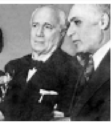
Иван Козловский эм Ираклий Абшидзе бла.