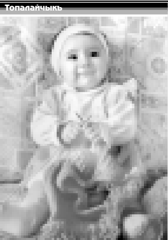
Безоланы Маликага жети ай болды. Ол Янкой элде жашайды.