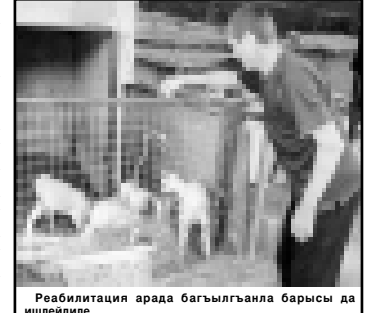
Реабилитация арада багыылганла барысы да ишлейдиле.