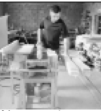
Реабилитация арада мастерскою.

Нарполеонга кыяуба бардырылган урууда уллу кыяиланлары болган аскерчилени сауугарга деп жаурашдырхан эди, 1939 жылда уа Гитлер аны жагынды хайырылган башлаганды. Бек биринчи 1813 жылда чыгарылган «Темир жорун» ююнде уа эмен бутаккыны сураты эм патчааны тукуну атыны эм кесини атыны биринчи харфлары керюне эдиле. Сауганы 1870 эм 1914 жылдада чыгарылган бля Пруссияны араларында бардырылган кызауатха эм Биринчи Дуня урушка жораланган эдиле. Бюгонюкдө уа «Темир жор» биринчи кыяыл алыш алыш белгиси, кыралны аскер техникасыны ююнде орнатылады. Алайды да, булайда Ючюнчө рейхни аскер сауугасыны ауанасыны ююсюнде сөз бара болмаз. «Известия» газетден.