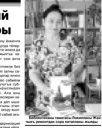
Библиотеканы таматасы Локиланы Жаңыкъ ремонтдан сора киталпаны жыды.

Энди ау ремонтну юсюнден. Класслада спортло-болу ишлени бошангъабыз. Спорт залы къалай аруу этгенибизни кескиз да кѳрдюгѳз. Къуру анда 300 квадрат метр барды. Къырал бир къоштылганын айтты кереклиси да бол-