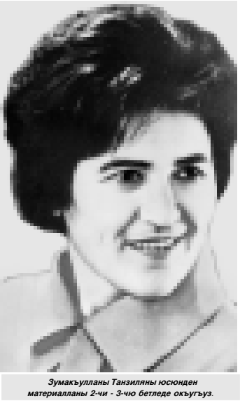
Зумакъулланы Танзиляны юсюнден материаллары 2-чи - 3-ю бетледе окъуугь.

Халкъыбызны ѳтмелигиди Танзила жарыкъ жулдуу, айтхылкъ къызы да. Мамырлыкь, тозюк, кертилик, соймеклик, ата журтуна бла миллетине кертичлей къалыу - ма ол жол бла барды намузуну таркыймазлыкь, дунияга аты айтхылган таза, багьыр да поэзиясы!