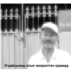
Кыясыны атын жюрюткен орамда.

Мискирланы Даутуну битеу андан ары жашауу Фрунзе - энди уа Бишкек - бла байланып кюночю анга «Кыргыз СОР» управлений мастери, прорабы, начальныгы да болуп турганды. Коллективге башчылык этюуде усталгычы, ара шахарны илгиригерге салган кыялыны кюночю анга «Кыргыз СОР» ны сылы кыруулуучусу» деген махтауу да да аталганы эди.