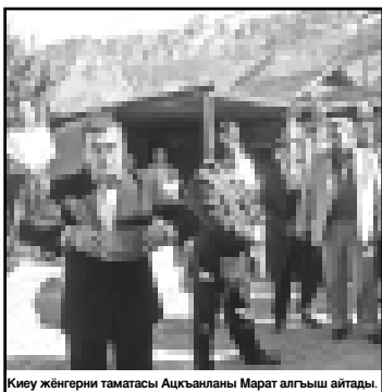
Киеу жегерни таматасы Адкыяланы Марат алгыны айтканды.

Келгиле кыруала баш Кызмала. Тебону ахш да жеген молоко бар эди: эки жарган ёлозо, төрт ийнеги, миңер аты, эки байыла тыйлары бля. Сора айтшындан аспам кысу да. Единочлени болуп жашады төрт жыл, тегерекке болган дегенде, кулак этип, болганын сыйырдыла да, фахырылык жырлы да жетдирилди. Ахырында, уруш