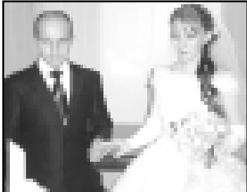
Келини баш ауун алган кези.

Мен, аланы тойлорында болуп, кысала бля эс кычан танышканын, халкыбызда жүрөгөн бир кыуам адет-төрөлени исперинде да ушак бардырганыма.