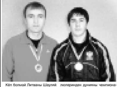
Кеп болмай Литваны Шаулул шахарында тутушуну кеп төрөлөрүндөн дунянын чемпионаты болганды. Ол санда бел бау