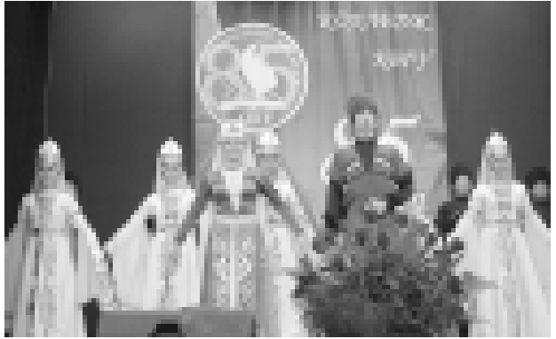
«Асса» сабий төпсеу ансамбль.

Кыуачуны ингири педагогика колледжи «Элегия» вокал ансамбли аханды. Омакы, ариу трируула бу окуу ююню гимнин жырлагыларынды. Жыйылганла алааа оковит тынгалгандыла.