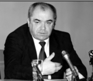
Нобэл и шабрыр нэлэ 70 ирнүүхэ Хэйдэ Дунэньшэнь бэйлэ хуульч дэбэ Уинэ сэймэ шынхыгээтэйлэл...