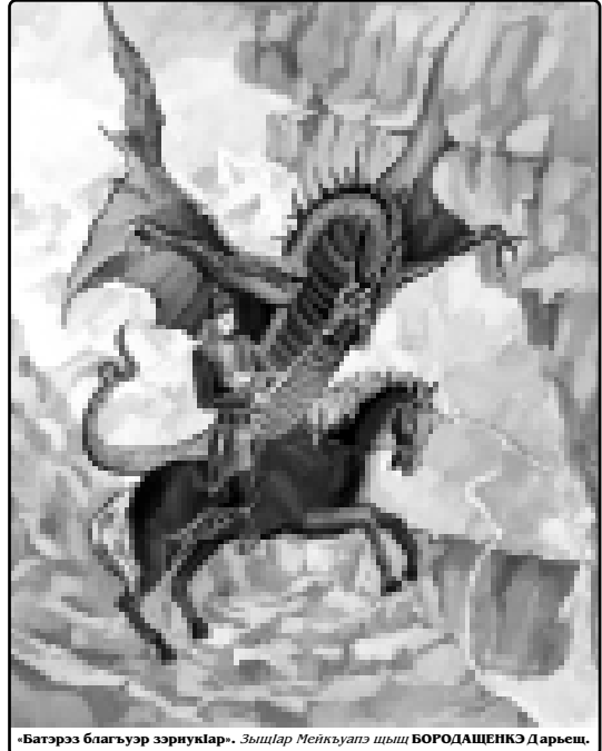
«Батэргэ блэгуэр зэрнукэр». Зышлар Мейкуэпэ шцы БОРОДАШЕНКЭ Даремн.

Жей Гуым хэмкэ, Шылым вагуэу тэп, Кышымуашыпкыкэ Сыншпыхэкэ баэ.