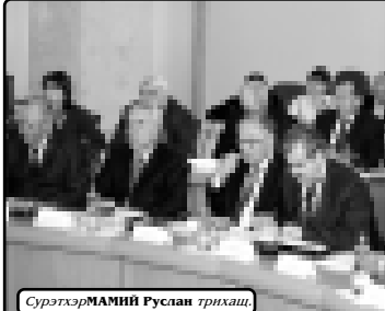
Суртхэр МАННИЙ Руслан грнхаш

Советым и мыгъэрэ апэ зэуэрэ... Президентым кынгълэзэ