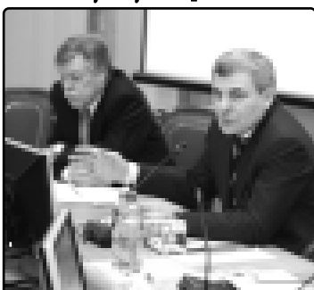
КъБР-м и Президент Къанокъуэ Арсенэ

Ди газетым зэрэйтхьэ... КъБР-м и Президент Къанокъуэ Арсенэ