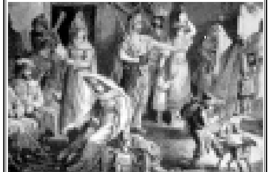
Тырку лымчархэм адыгэ истамбалакхуэр болгар унэхэм трагуашэ. Суртыгэ Канити Ф.Ф. ищаджэ. 1875 гъэ