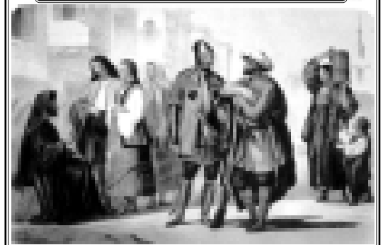
Дунай псы лүфэм шыпсуу адыгэхэр. 1867 гъэ