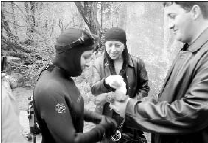
Тюльпаны – подарок за мужество