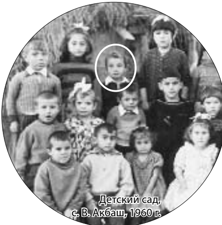
Детский сад, с. В. Акбаш, 1960 г.

Гораздо позже начал изучать мировую и адыгскую мифологию. Эти знания и ощущения наложились друг на друга, сложились в единую мозаику. Все это появляется потом на холсте. И когда абстракционист рисует "какие-то пятнышки", надо иметь в виду, что за ними — огромный культурный пласт во времени и пространстве.