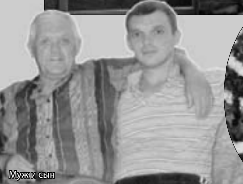
Муж и сын