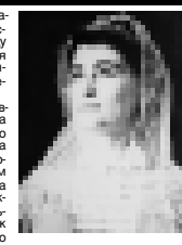
ее исполнением танцы, как «Кады» и «Исламий».