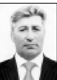
участвовал в двух войнах.